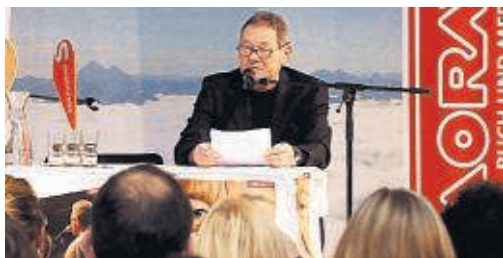
Wolfgang Ambros las aus seinem Leben