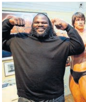
Mark Henry posierte gut gelaunt im Schwarzenegger-Museum

So sanft kann sich ein WWE-Wrestler freuen: Mark Henry , im Showsport besser bekannt als „The World’s Strongest Man“, besuchte gestern vor dem WWE-Abend in der Grazer Stadthalle das Schwarzenegger-Museum in Thal. „Ich bin ein Fan und wollte unbedingt hierher. Das Schöne an meinem Beruf ist, dass ich bei Reisen solche Orte wie das Geburtshaus von Arnold Schwarzenegger sehen kann“, zeigte sich der massige 40-Jährige beeindruckt. Henry verbindet auch ein sportlicher Erfolg mit der steirischen Eiche: Der 40-Jährige gewann 2002 die offizielle „Arnold Strongman Classic“.